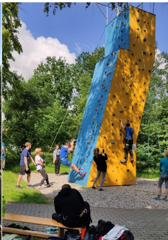
Lezecká stěna na Pokorného