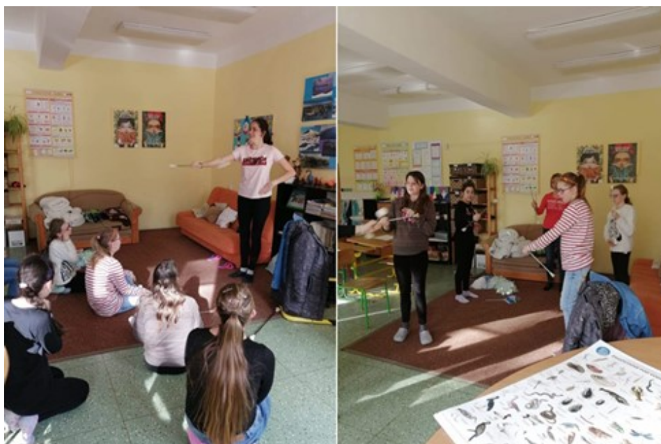
Dívčí klub mažoretky