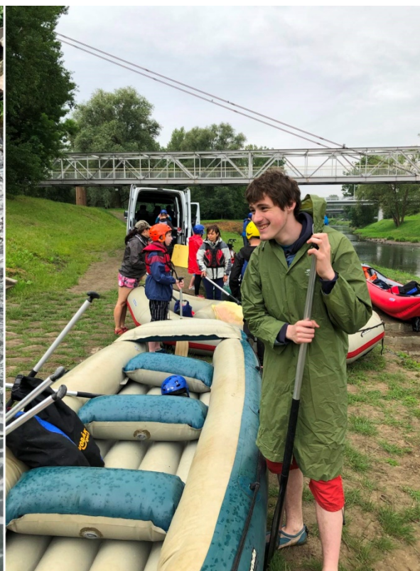
Vodácká akce - sjezd řek Ostravice a Odry