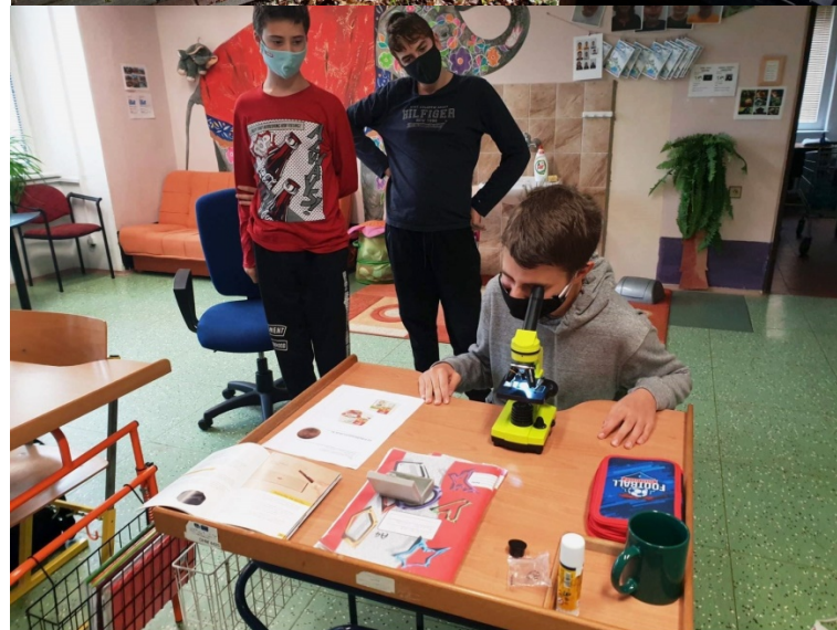
Badatelská činnost s využitím mikroskopu