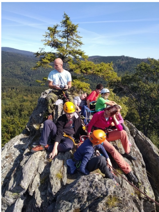
Lezci na Rabštejně

Základní škola a Mateřská škola, Ostrava – Poruba, Ukrajinská 19, příspěvková organizace