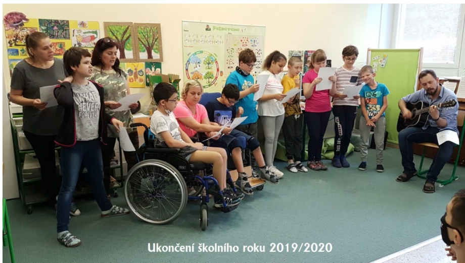
Ukončení školního roku 2019/2020